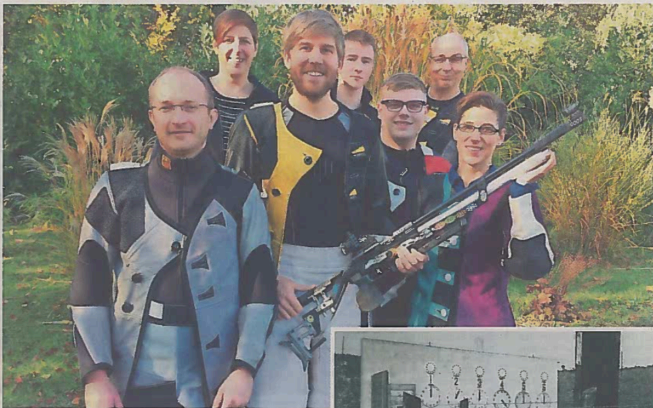
Die Luftgewehr Freiland-Mannschaft feiert ab morgen mit. 1935 wurde noch an einem Hochanzeigerstand (Bild rechts) geschossen.